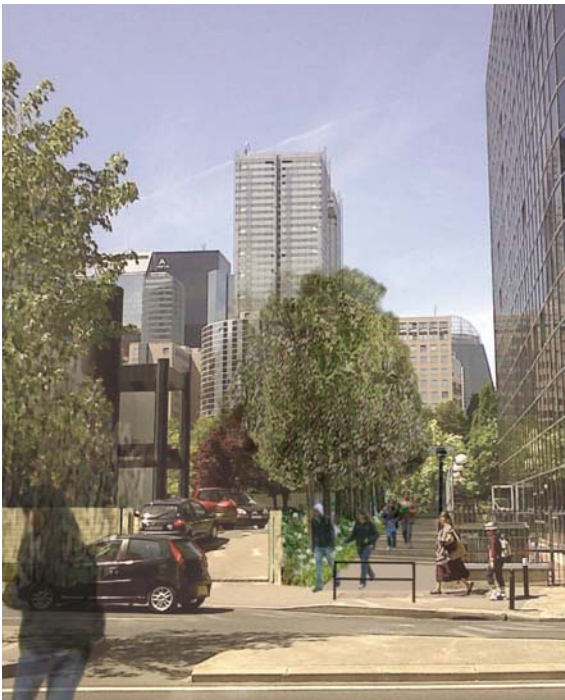
Entrée de la nouvelle allée piétonne, coté rue Louis Blanc.