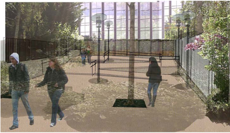
Nouvel accès au collège des Renardières, coté parc Diderot