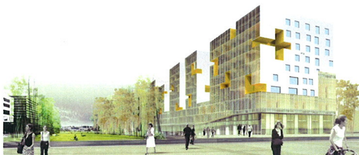
L'immeuble de Logements de la Terrasse 11 en 2012